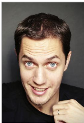
Grand Corps Malade