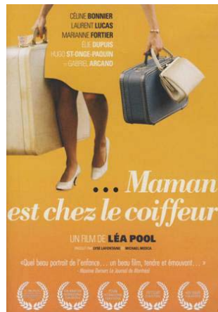
Maman est chez le coiffeur De Léa Pool

En accord avec la SODEC et avec l'appui de la Délégation générale Québec, une première expérience pourrait être tentée à l'automne autour de trois films à disposition :