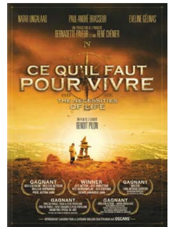
Ce qu'il faut pour vivre De Benoit Pilon

Pour cela, il est primordial et essentiel que les Régionales intéressées se rapprochent d'un cinéma pour un partenariat. Celui-ci pourra assurer : le coût modique (environ 80 euros de mise à disposition + frais de transporteur), la communication, la logistique technique, l'assurance.